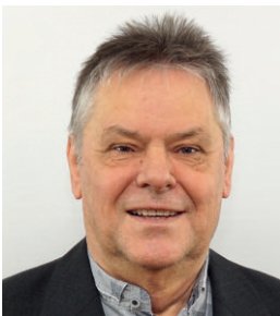
Helmut Teis Erster Beigeordneter